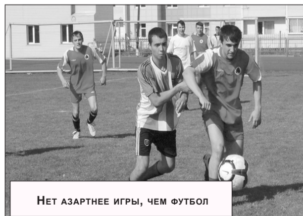
Нет азартнее игры, чем футбол