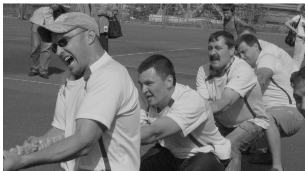
Богатыри погрузочно-транспортного управления