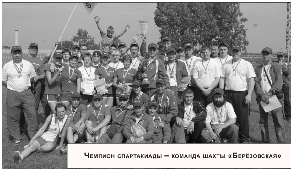
Чемпион спартакиады – команда шахты «Берёзовская»

- В пятницу прошли торжества по случаю трудовой победы на шахте «Берёзовская», а сегодня мы будем праздновать спортивные победы. Формат спорт соревнований увеличился: в этом году мы провели лыжные гонки, зимнюю рыбалку, летнюю рыбалку, профессиональную эстафету. Это говорит о том, что здоровый образ жизни все больше входит в наше сознание. Успехов вам на спортивных площад-